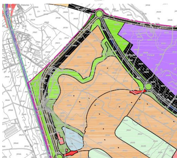
Zonificación de la Parcela R7 y recorte de zonificación del Plan Parcial con la ubicación de zonas verdes.

Este estudio de detalle completa la ordenación interior la parcela R7 y anula la ordenación definida en el Estudio de Detalle aprobado definitivamente el 26 de julio de 2007. NO AFECTA a viales ni a parcelas de titularidad pública y se distribuye la edificabilidad total asignada a la parcela R7 en el Proyecto de Innecesariedad de Reparcelación.